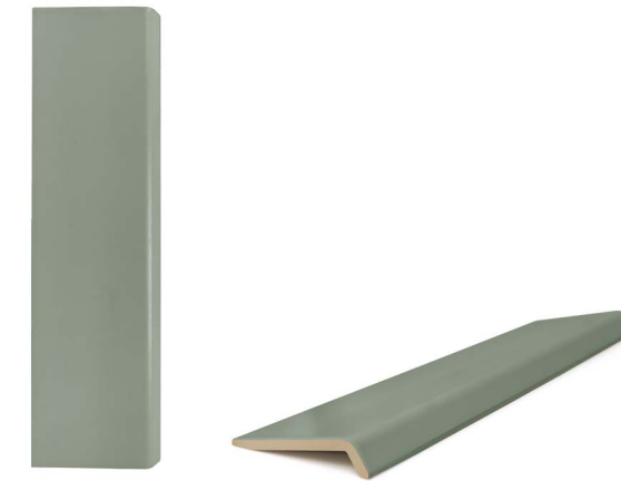
37875 ONA GREEN/12X45 H48 (12x45 cm — 4 3 / 4 x17 3 / 4 *) **19 Kerakoll