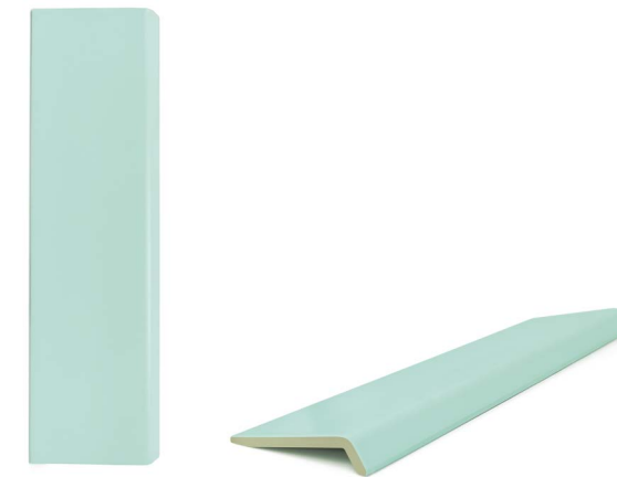
37876 ONA MINT/12X45 H48 (12x45 cm — 4 3 / 4 x17 3 / 4 *) **100 Mapei