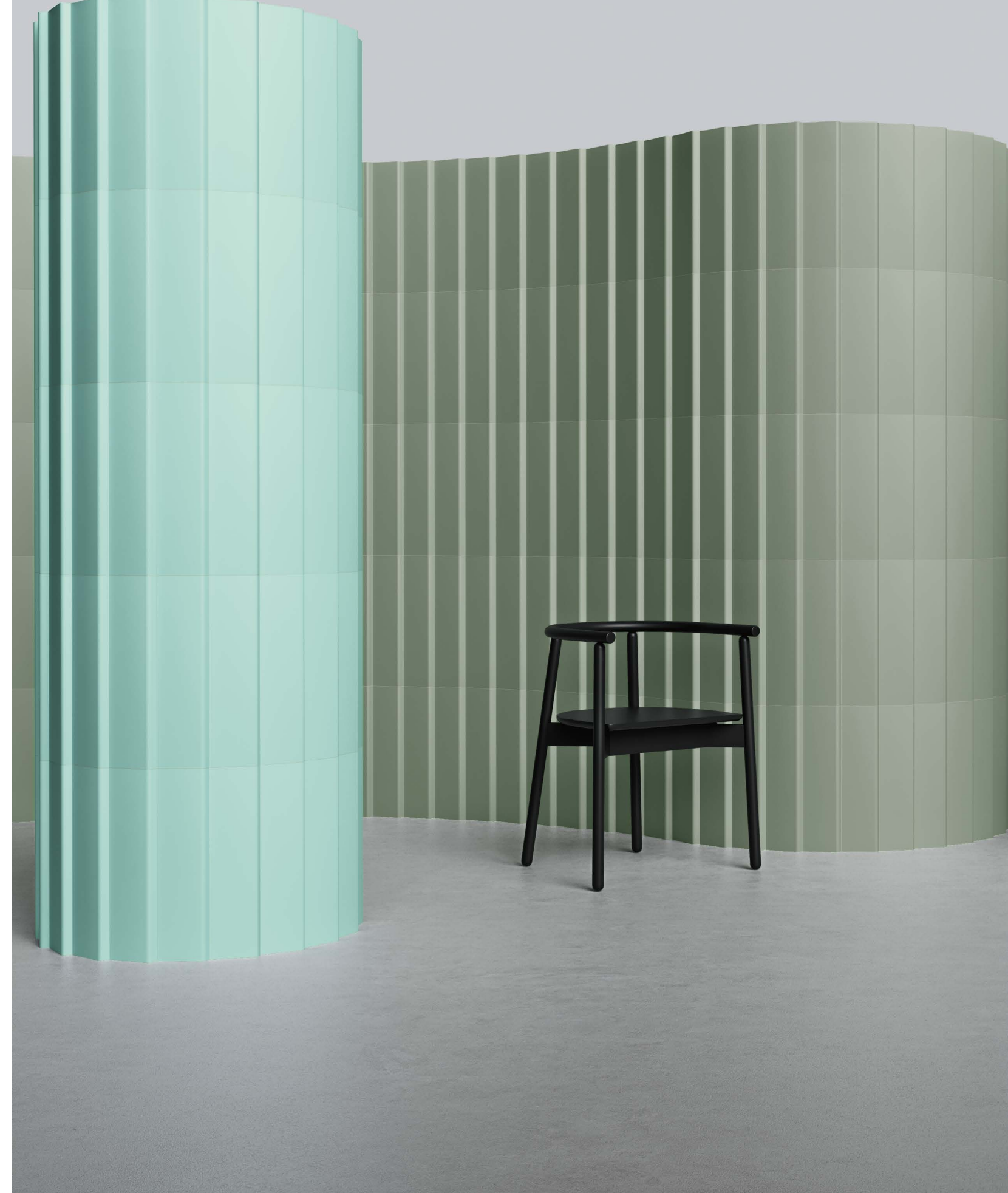
● ONA GREEN/12X45 · ONA MINT/12X45