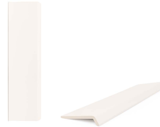
37871 ONA WHITE/12X45 H48 (12x45 cm — 4 3 / 4 x17 3 / 4 *) *100 Mapei