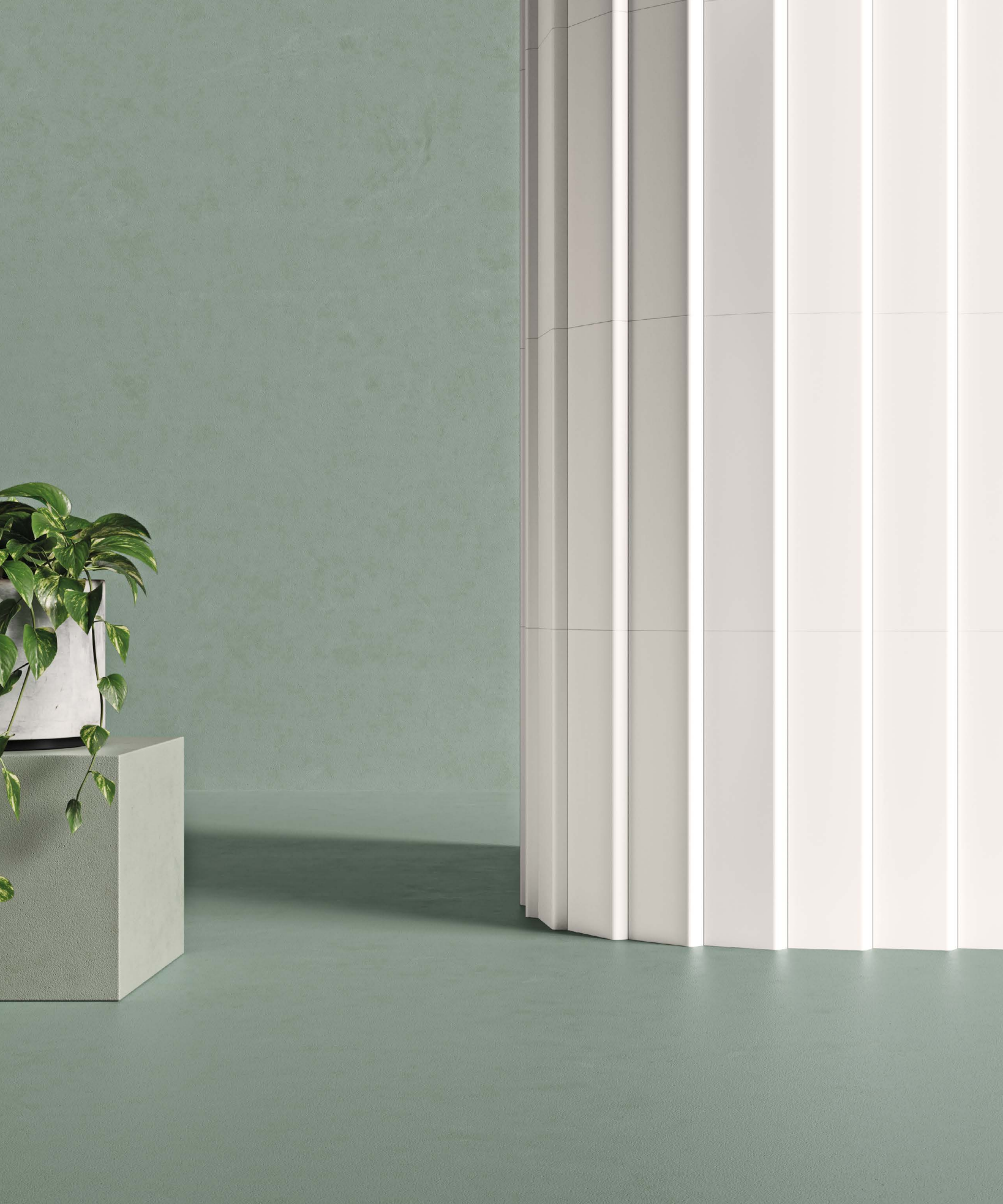
● ONA WHITE/12X45